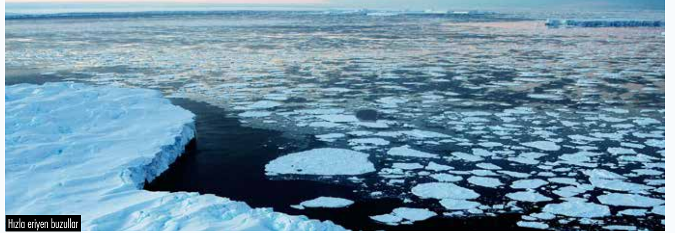
Hızla eriyen buzullar

Koronavirüsün uçuşlarda, otomobil kullanımında azalmaya, Hindistan'ın kömür ithalatında %14 oranında düşüşe yol açtığı, salgının yarattığı gelişmelerle emisyon miktarlarının azalmasının olumlu bir gelişme olduğu ifade ediliyor. Ama küresel emisyonlarda yaşanacak bu düşüşün kısa süreli olacağı çok açık.