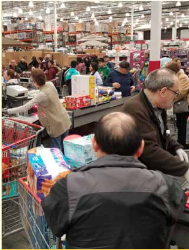
Marketlerde asgari ücretle çalışmak zorunda olan işçiler, salgınla savaşıyor sağlık emekçileri ve işe gitmek zorundaki milyonlarca insan için acil önlemler alınmıyor.