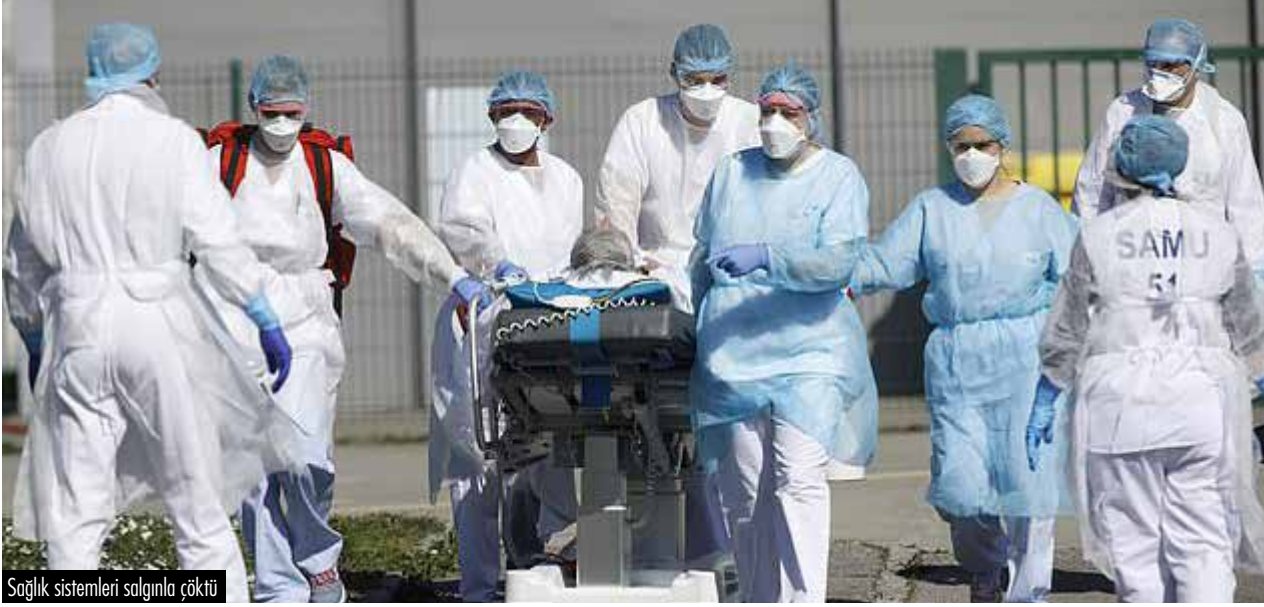
Sağlık sistemleri salgınla çöktü