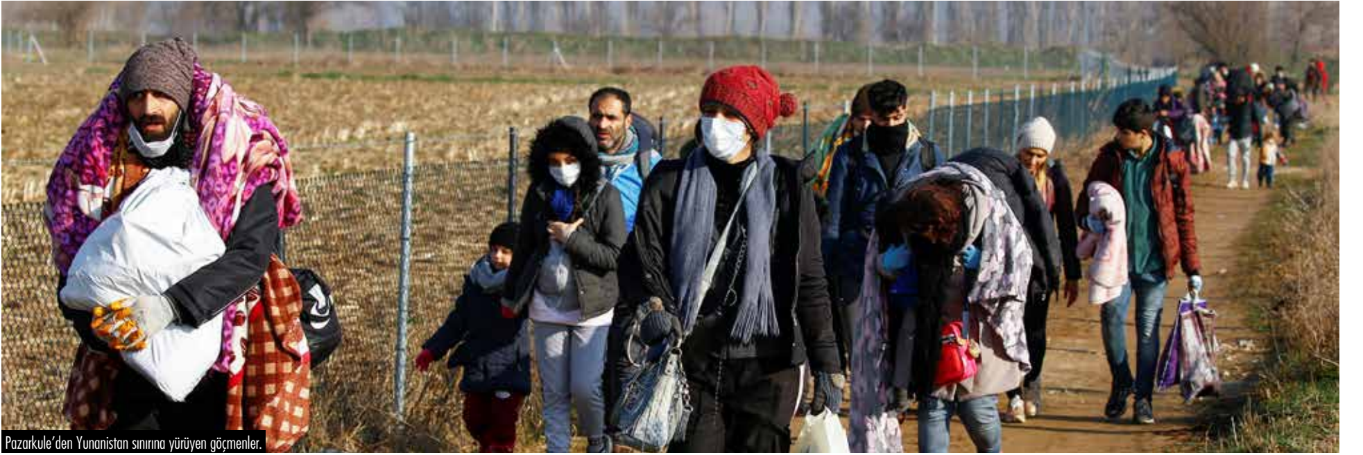
Pazarkule'den Yunanistan sınırına yürüyen göçmenler.