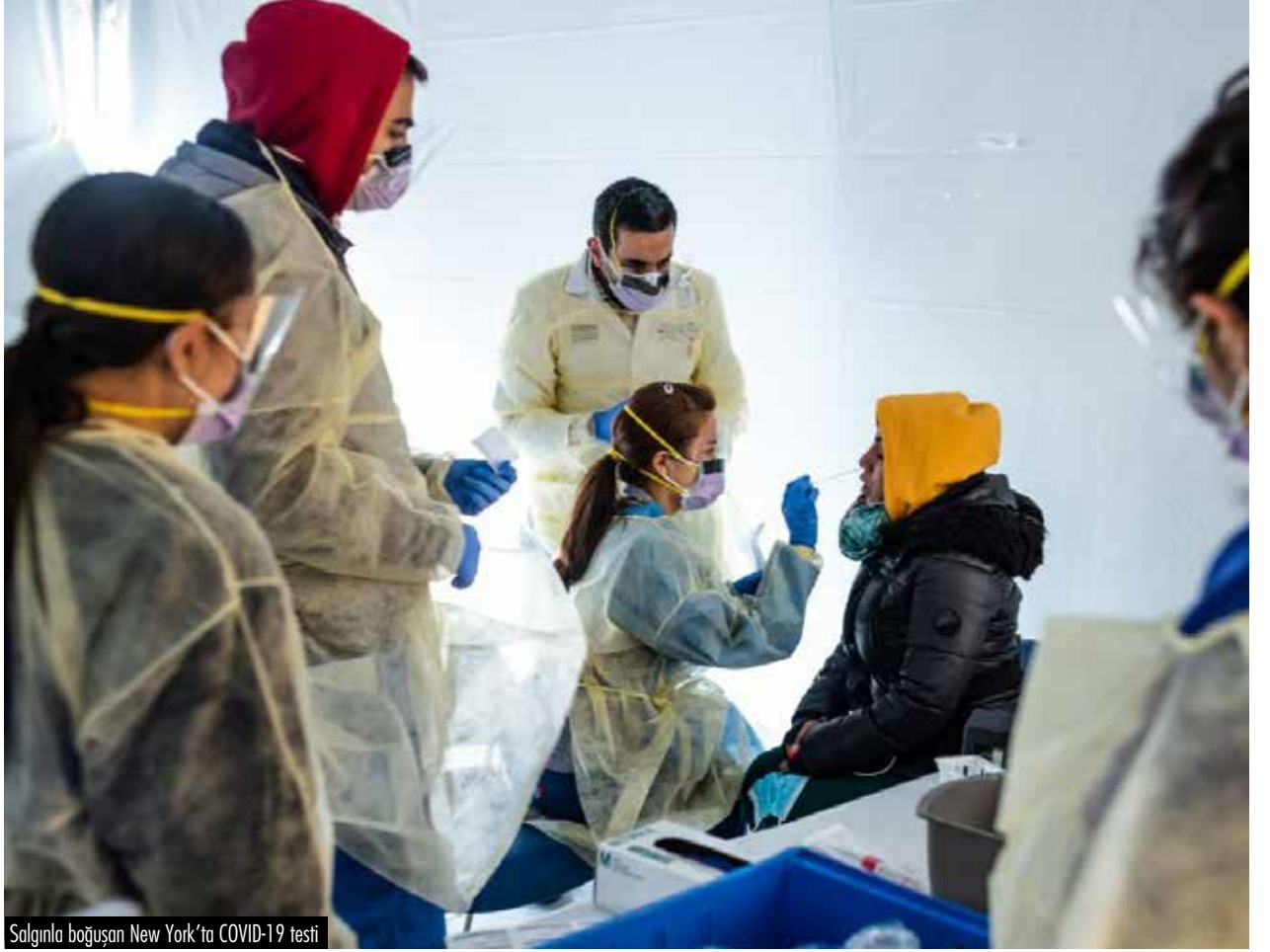
Salgınla boğuşan New York'ta COVID-19 testi

Bireysel anlamda değerlendirdiğimizde, bunun ciddi bir disiplin ve sorumluluk meselesi olduğu çok açık. Bireylerin kendilerini bu konuda sorumlu hissetmeleri; sadece kendimizin değil, başkalarının da sağlığına katkıda bulunmaya gönüllü olmak demek. Ve bu da içinde yetiştiğimiz kültür tarafından şekillendirilen bir tutum. Tek nesilde hayata geçirilmiş olması da yeterli değil, sürdürülebilmesi için dinamik bir istikrara ihtiyaç var. Üzerimize düşeni yapar, dayanışmayı ve toplumsal birliği sağlar, bunu kolektif bir mücadeleye dönüştürebilsek zaten içine hapsediğimiz kan emici sistemi yerle bir edebilecek kadar güçlü olduğumuzun da farkına varmış oluyoruz. Ancak bu esnada ihtiyaç duyulan araçlar nüfusun tamamına yayılacak şekilde