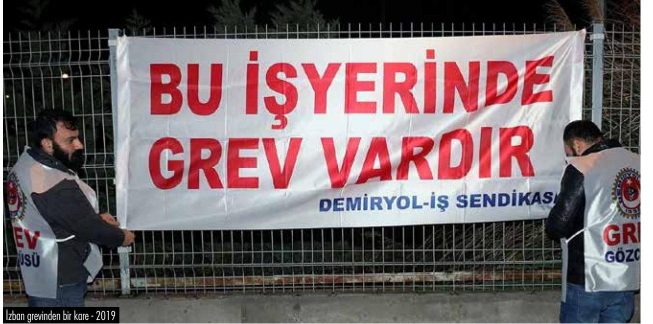
İzban grevinden bir kare - 2019