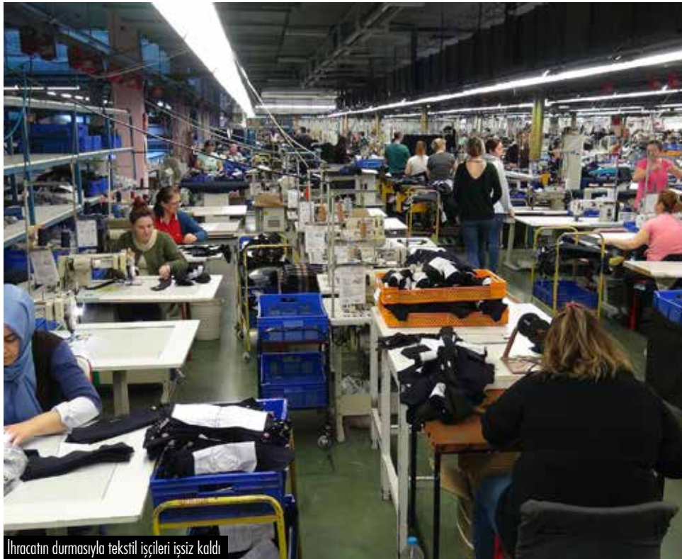
İhracatın durmasıyla tekstil işçileri işsiz kaldı

Dünyayı sarsan bir salgınla karşı karşıyayız. En küçüğünden en büyüğüne tüm yönetimler insan hayatı ile sınıyorlar. Aldıkları ya da almakta geciktikleri kararlar insanların canına mal oluyor. Daha önce benzeri görülmemiş bir salgın olduğu için elbette biraz kervan yolda düzülüyor. Herkes yaşayarak öğreniyor. Ama tabii ki bu kadar masum bir süreçten geçmiyoruz. Karar alma süreçlerinde yönetimlerin öncelikleri her ülkenin ve işletmenin nasıl bir yönetim anlayışına sahip olduğunu da gösteriyor. İnsan hayatını öne alan karar süreçleri, salgının yayılmasını önüyor, ölümleri en aza indiriyor. Kar amaçlı karar süreçleri ise, her gün yeni bir fırsatçılık olarak karşımıza çıkıyor. Korona adeta bir turnusol görevi görmektedir. Pahalı olduğu için işyerlerinde hijyen önlemlerinin alınmaması ile başlayan süreçte, öden-