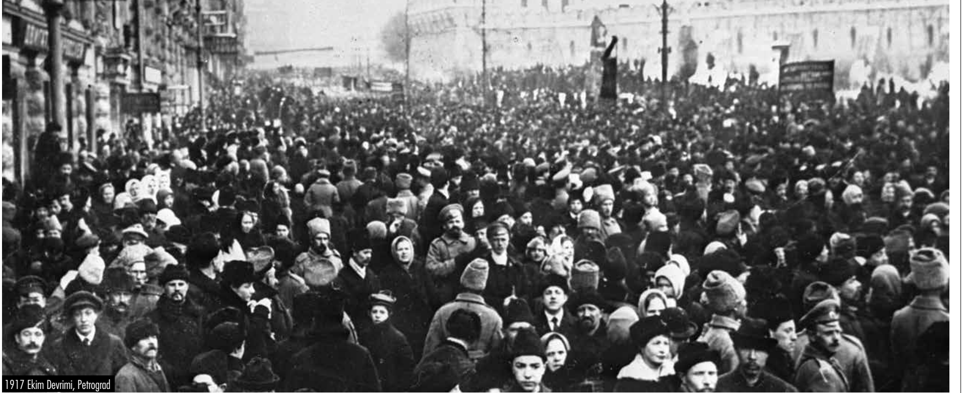
1917 Ekim Devrimi, Petrograd