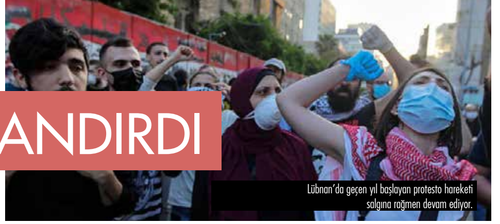
Lübnan'da geçen yıl başlayan protesto hareketi salgına rağmen devam ediyor.