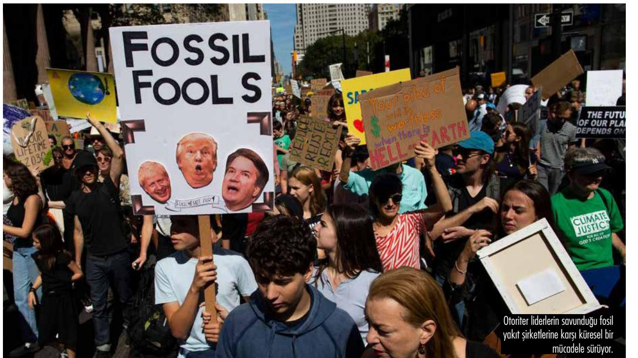
Otoriter liderlerin savunduğu fosil yakıt şirketlerine karşı küresel bir mücadele sürüyor.

Korona günlerinde yaşanan yüzde 5,5'lük düşüş IPCC'nin belirlediği yıllık emisyon azaltım hedeflerinin altında. Kısacası bu düşüş miktarı yeterli değil. Üstelik bu oranda düşüşün tek bir yıl değil, her yıl yapılması gerekiyor. Ama bundan daha önemli olan üç şey var. Birincisi bu düşüşü sağlayan şeyin küresel ölçekte yaşanan salgının ani bir biçimde yarattığı koşullar sonucu oluşmuş olması. IPCC'nin