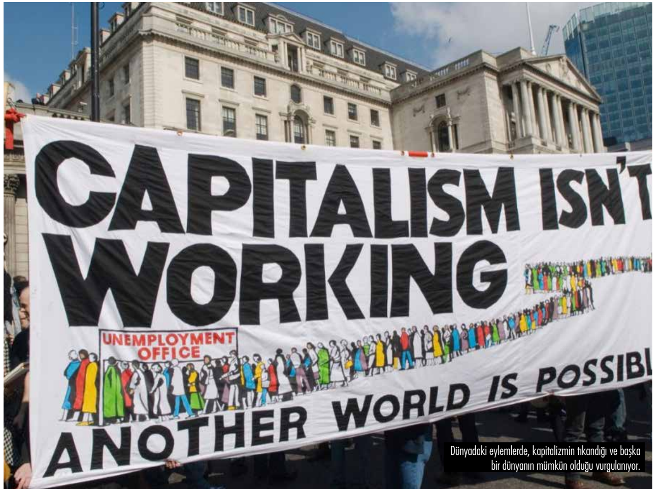
Dünyadaki eylemlerde, kapitalizmin tıkanıp ve başka bir dünyanın mümkün olduğu vurgulanıyor.

Koronavirüs vakaları listesine bakıldığında en başta yer alan devletler, (7. sıra-