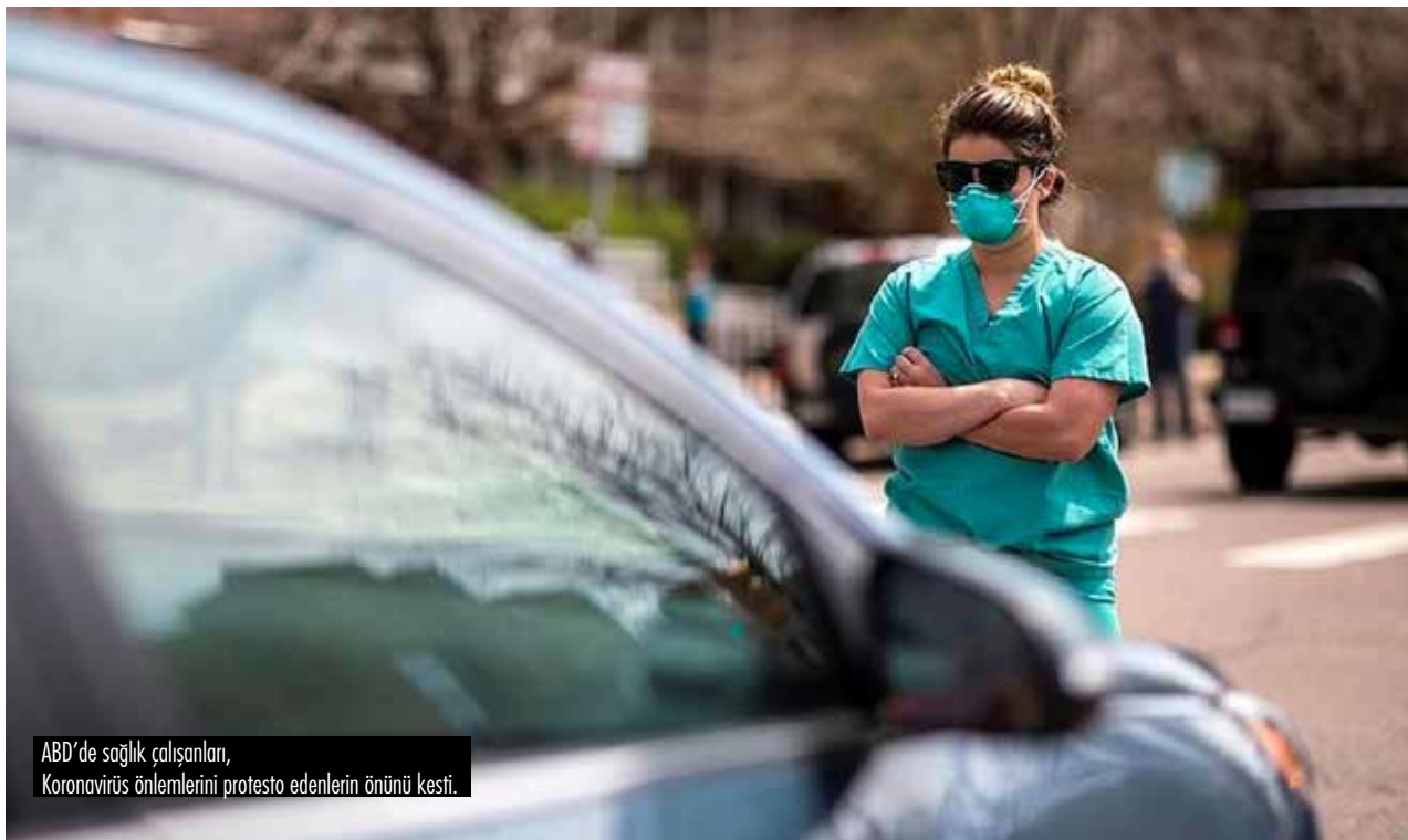
ABD'de sağlık çalışanları, Koronavirüs önlemlerini protesto edenlerin önünü kesti.

Eşitsizliği ve adaletsizliği devam ettirecek olan bir "normal" dünyaya dönmek istiyor muyuz ki?